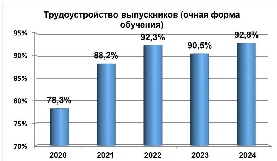
Рисунок 2.4 – Трудоустройство выпускников

Динамика трудоустройства выпускников за 2020-2024 годы показана на рисунке 2.4.