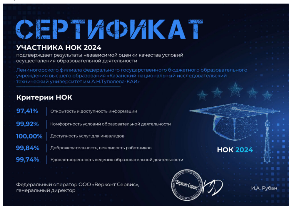
Рисунок 2.3 – Сертификат участника НОК

В целях определения степени удовлетворенности образовательным процессом (содержанием, организацией, качеством учебного процесса) проводятся опросы (анонимно) обучающихся, преподавателей.